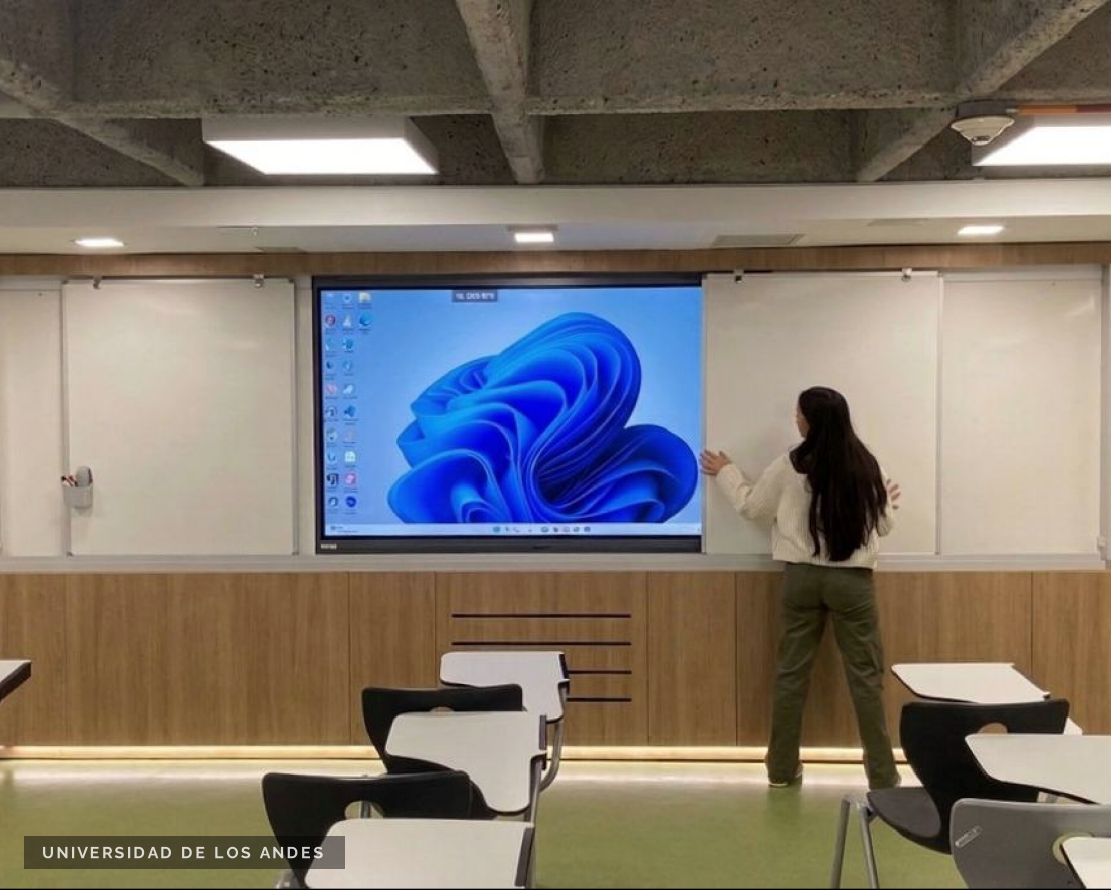
UNIVERSIDAD DE LOS ANDES